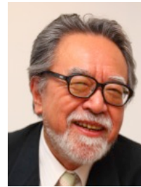
玉木 正之 スポーツ・文化評論家

講師 玉木 正之 × ロバート・ホワイティング 1964年の東京を知る2人が、秘蔵の画像や映像を用いながら、当時から今日までの日本人と日本社会の変化を検証する。