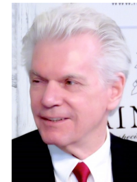
ロバート・ホワイティング 作家・ジャーナリスト

東京大学教養学部在学中より東京新聞紙上で執筆活動を開始。日本で最初のスポーツライターを名乗る。著書に「スポーツとは何か」（講談社現代新書）など多数。訳書にR・ホワイティング「ふたつのオリンピック」（KADOKAWA）、「和をもって日本となす」（角川文庫）など。