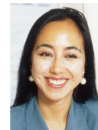
長田 渚左 ノンフィクション作家

ラグビーワールドカップ2019組織委員会顧問。東京2020機運醸成意見交換会委員。ワールドマスタースゲームズ2021関西組織委員会委員・参与。JOC総務委員。日本ワールドゲームズ協会執行理事。GAISF国際スポーツ団体連合元理事。